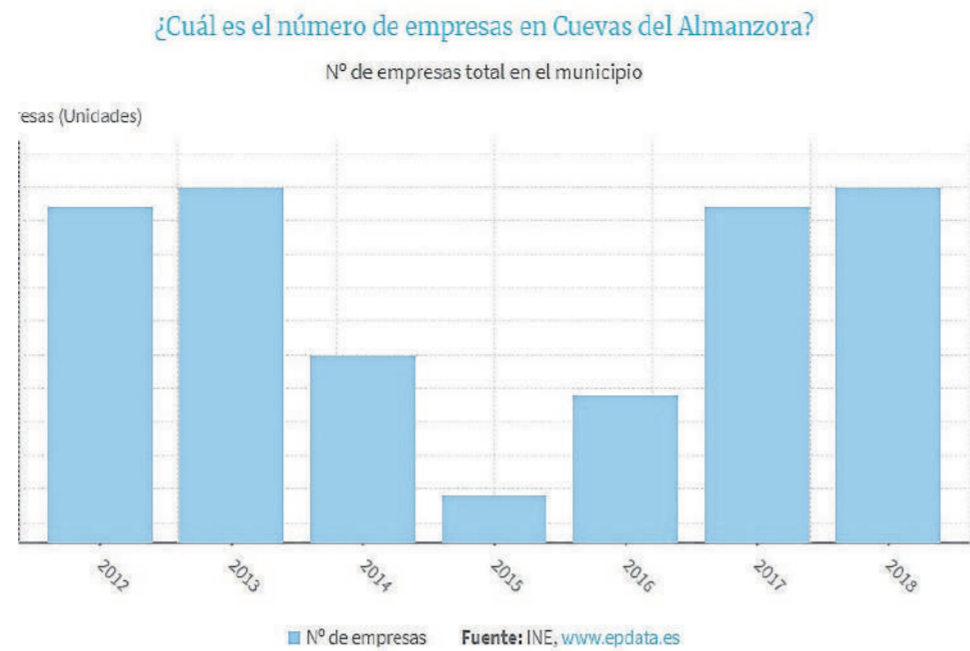
Gráfico de la evolución del número de empresas en Cuevas del Almanzora.