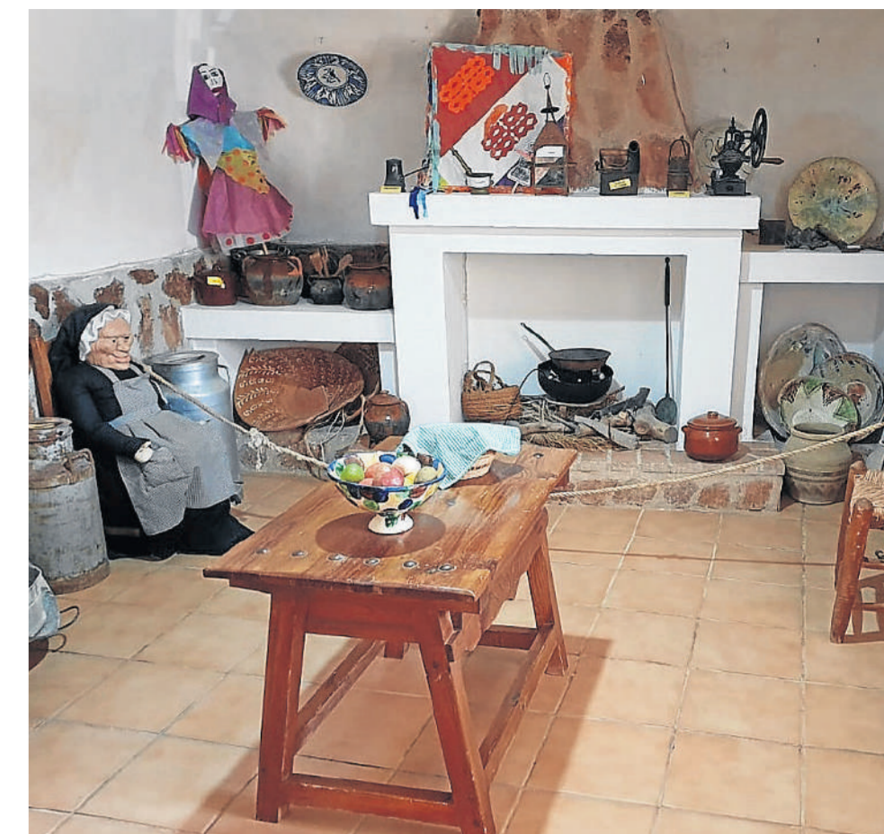
La cocina con la chimenea y algunos enseres habituales de la época.

La Cueva Museo se encuentra detrás del Castillo del Marqués de los Vélez, por lo que aquel que quiera visitarlas tendrá que subir a lo alto del pueblo para poder disfrutarlas y, de paso, admirar el monumento más emblemático del municipio, una fortaleza cargada de historia y de belleza.