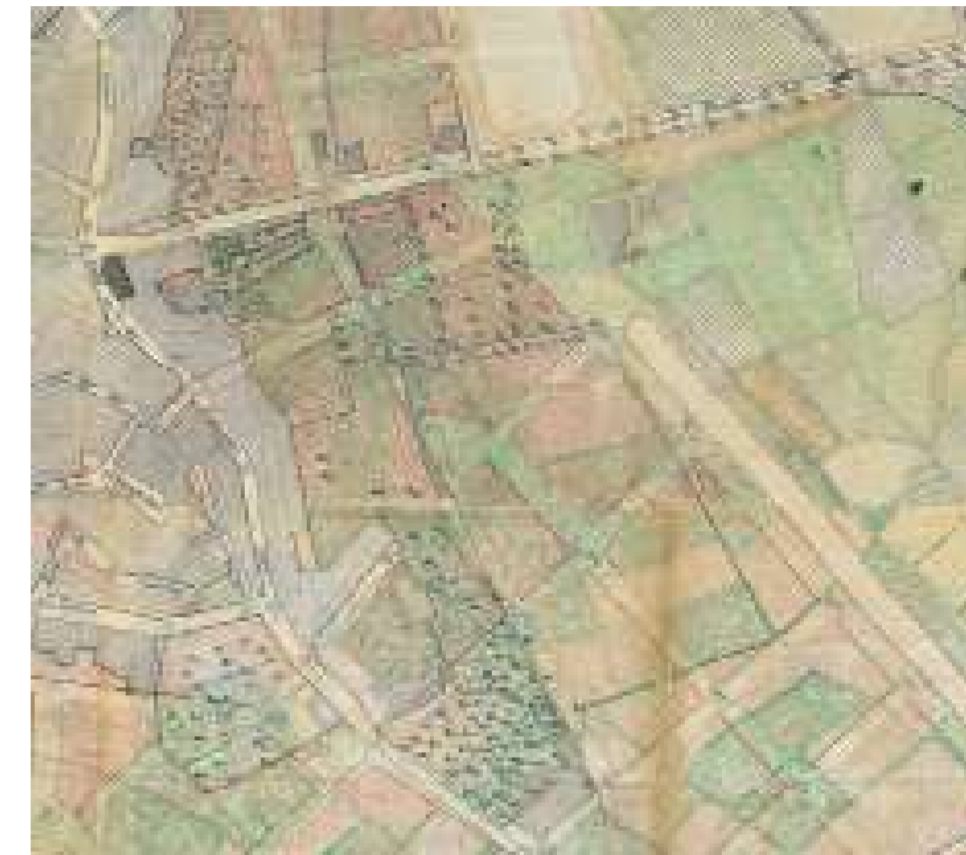
[Ilustraciones: Secciones del plano del “Proyecto de Ensanche y Mejora de la ciudad de Cuevas”. Archivo Municipal de Cuevas del Almanzora. En la primera podemos ver parte de las calles La Rambla, San Antonio (actual Calle del Convento), Las Angustias (actual Calle Las lisas) y de la Carretera Provincial de Cuevas a Vera (actual Avda. de Barcelona), que, partiendo de la calle La Rambla, bajaba hasta el río, por cuya margen derecha se prolongaba hasta Los Silos y Vera. También se aprecia claramente la separación entre lo que entonces era el casco urbano y la vega. La segunda ilustración es una sección de la primera que intenta delimitar el área donde estuvo ubicado el Huerto del Marqués]