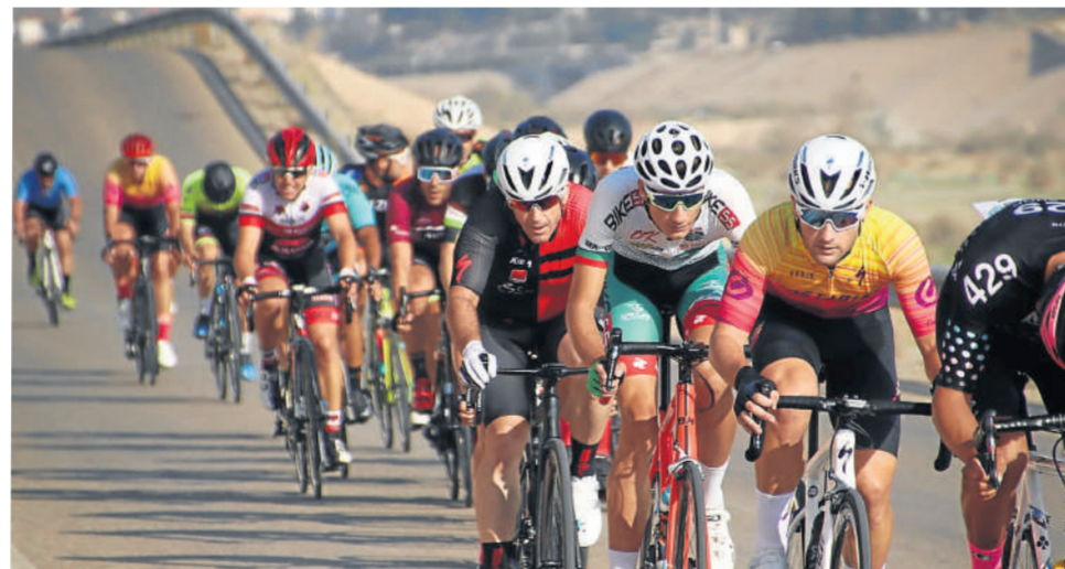
Ciclistas participantes en la III Carrera Urbana por la localidad cuevana.