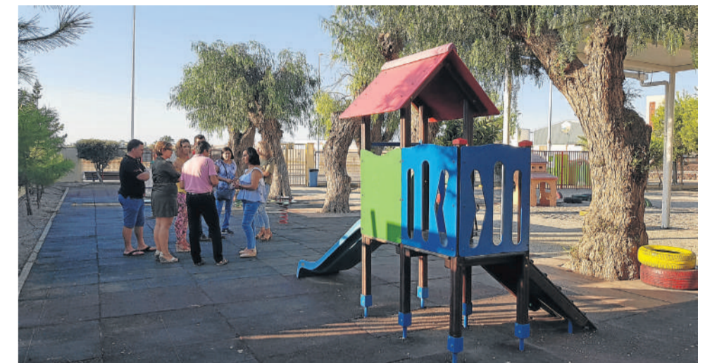
Representantes del AMPA, del colegio y del Ayuntamiento en el nuevo parque del patio del colegio.