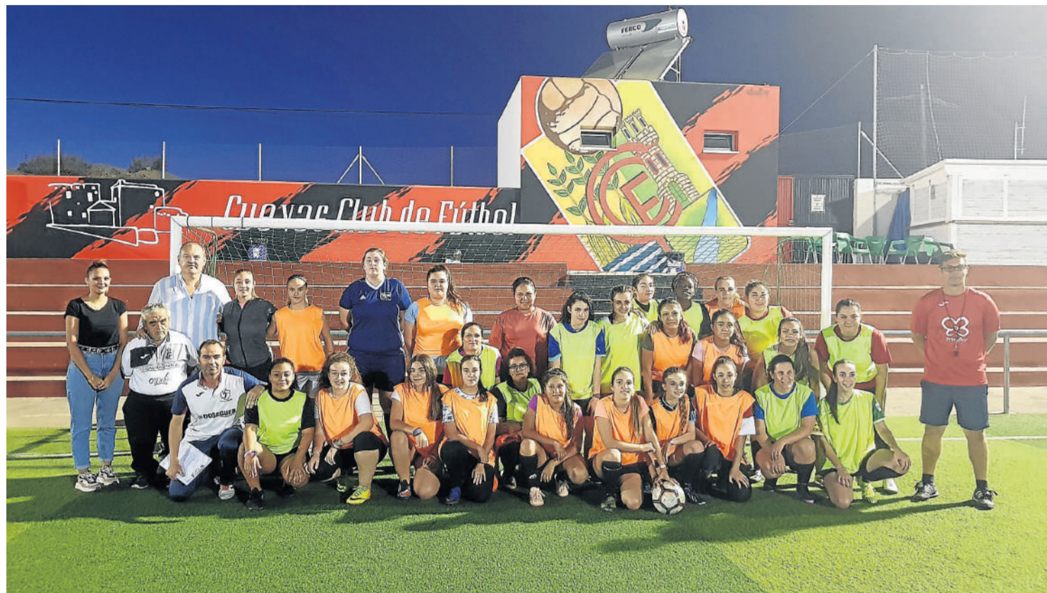
Escuela Deportiva de Fútbol 11 Femenino junto a entrenadores, la concejala de Deportes y el alcalde.

La concejalía de Deportes amplía su oferta con nuevas modalidades como fútbol femenino, laureados por la prensa provincial