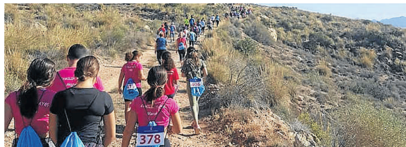
La ruta de senderismo congregó a jóvenes, niños y mayores como actividad previa a la Feria y Fiestas de la pedanía cuevana.

Con motivo de las fiestas de Guazamara, se realizó la tradicional ruta senderista en Guazamara: deporte y convivencia pre-feria.