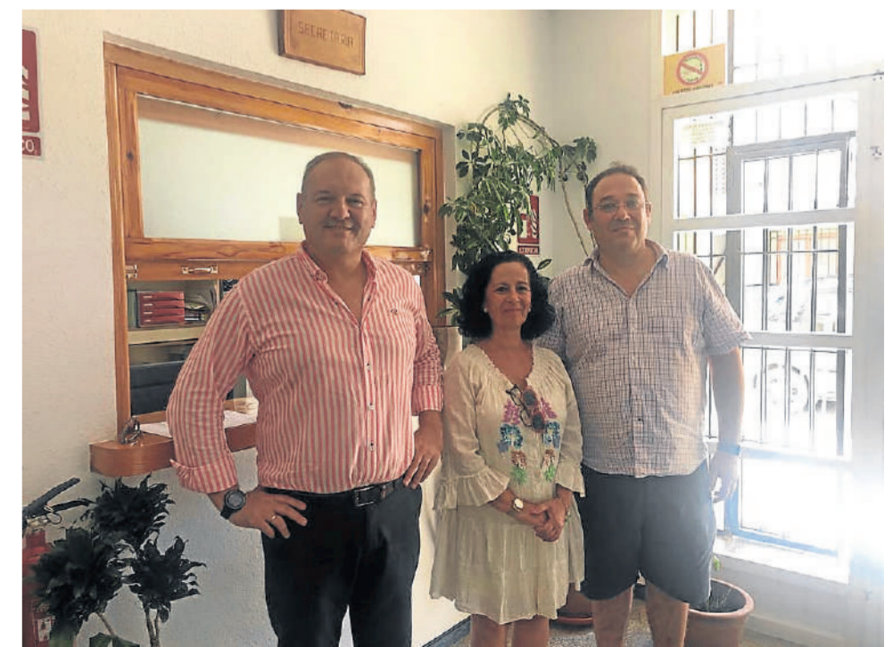
Visita del alcalde y la concejala de Educación al Conservatorio Profesional.

Como manifestó el primer edil, "se ha hecho realidad una reivindicación de la ciudadanía por hacernos ver la importancia de tener enseñanzas profesionales en nuestro municipio, gracias al empeño de padres, alumnos, profesores y amantes de la música, desde hace más de 20 años".