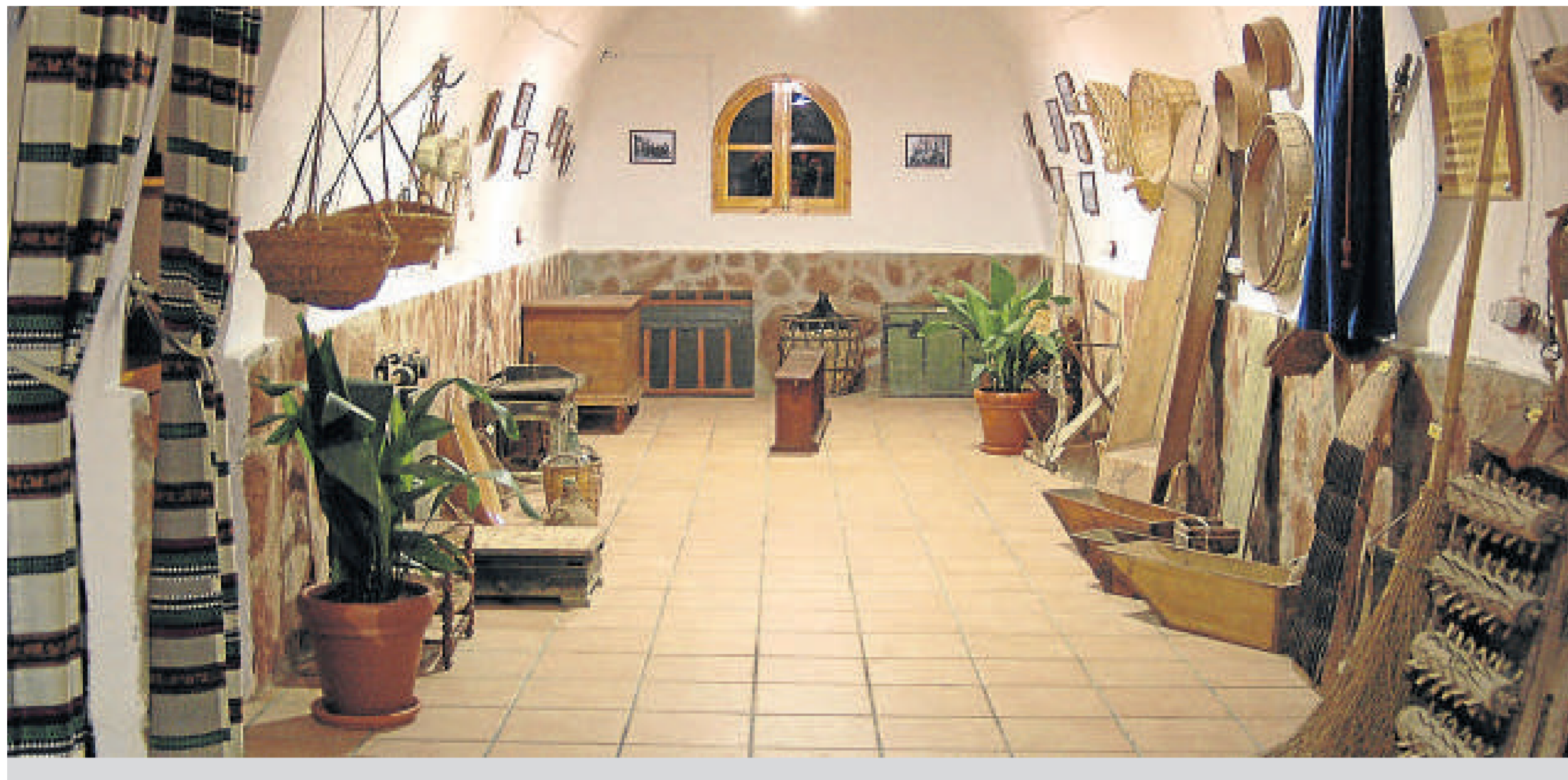
Sala principal de la Cueva Museo con una esmerada muestra de utensilios de labranza y de la vida cotidiana del siglo pasado.